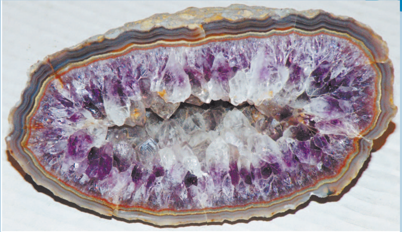
Geoda ametystowo-kwarcowo-agatowa. Pozostałość gazowego „bąbla” uwiecznionego w skale wulkanicznej. Prowincja Minas Gerais, Brazylia. Zbiory Janusza Gradowskiego.

Brzmi to może banalnie, ale żyjemy w otoczeniu skał. Są one skomplikowaną mieszaniną pierwiastków, które najczęściej występują w związkach chemicznych. Pierwiastki i ich związki tworzą struktury krystaliczne którymi są minerały. Zatem skały są zbudowane z minerałów, natomiast ich specyficzny wygląd związany jest w dużym stopniu z formami skupień tych ostatnich.