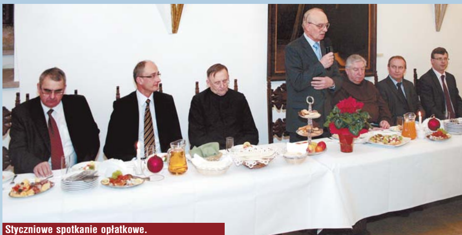
Styczeniowe spotkanie opłatkowe.